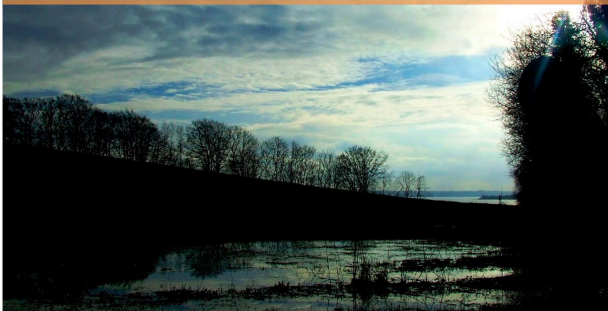
Dánia, fjord, ingovány: Nórkedvenchely

SASHA: most perpillanat New Orleans – az Egyesült Államok 46. legnagyobb települése, a jazz zene fellegvára, a lazaság fővárosa és nem utolsósorban a New Orleans Saints amerikaifoci-csapat otthona, amit egy hatalmas Dome-nak (kupola) nevezett építménnyel is jeleznek. Who Dat!